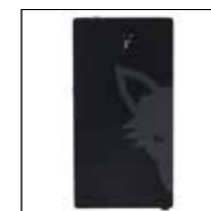
Freddo der große Kompressor-Kühlschrank (Milchkühler) 8 l