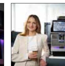
Macht vor allem im Büro eine gute Figur.