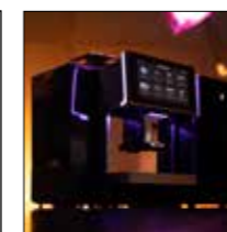
PREMANO 150 formschön und hoch funktional